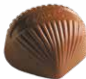
Praliné met brésilienne