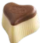
Praliné marron glacé